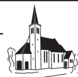
St. Johannes Kirche